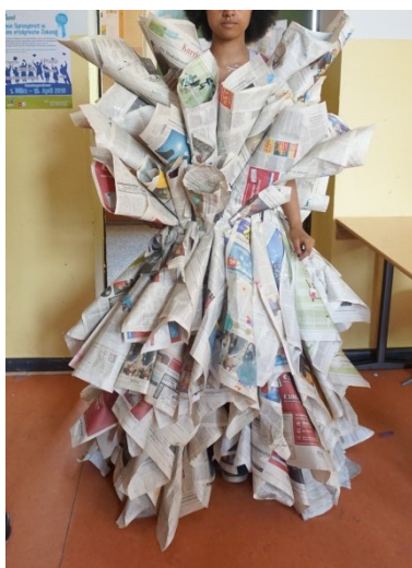
Gruppenarbeit zum Thema „Kleider aus ungewöhnlichem Material“; verwendete Medien/ Materialien: Zeitungspapier, fotografische und filmische Dokumentation