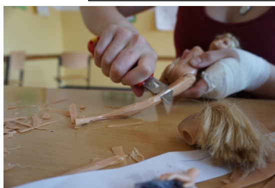
Gruppenarbeit zum Thema „Schönheitsideal“; verwendete Medien/ Materialien: Barbies, Styrodurplatte, Puppenkleidung, Gips, fotografische Dokumentation