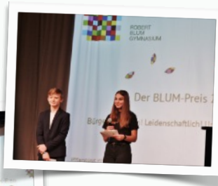
1. BLUM-Preisverleihung 8.11.2019

Die Schülerschaft wird den BLUM-Preis an gesellschaftlich aktive Initiativen oder Personen verleihen, die sich ehrenamtlich und sozial engagieren.